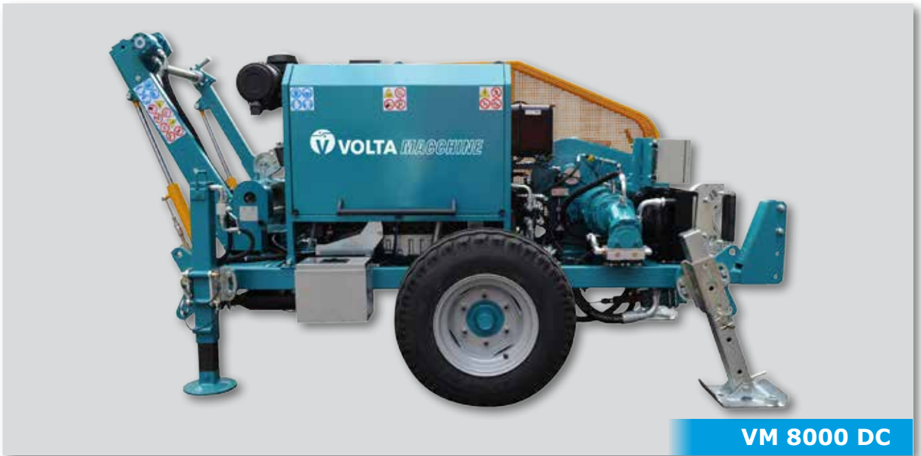
VM 8000 DC