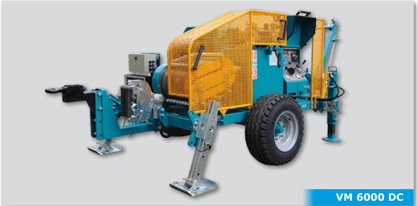
VM 6000 DC