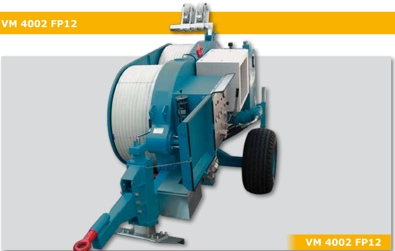
VM 4002 FP12