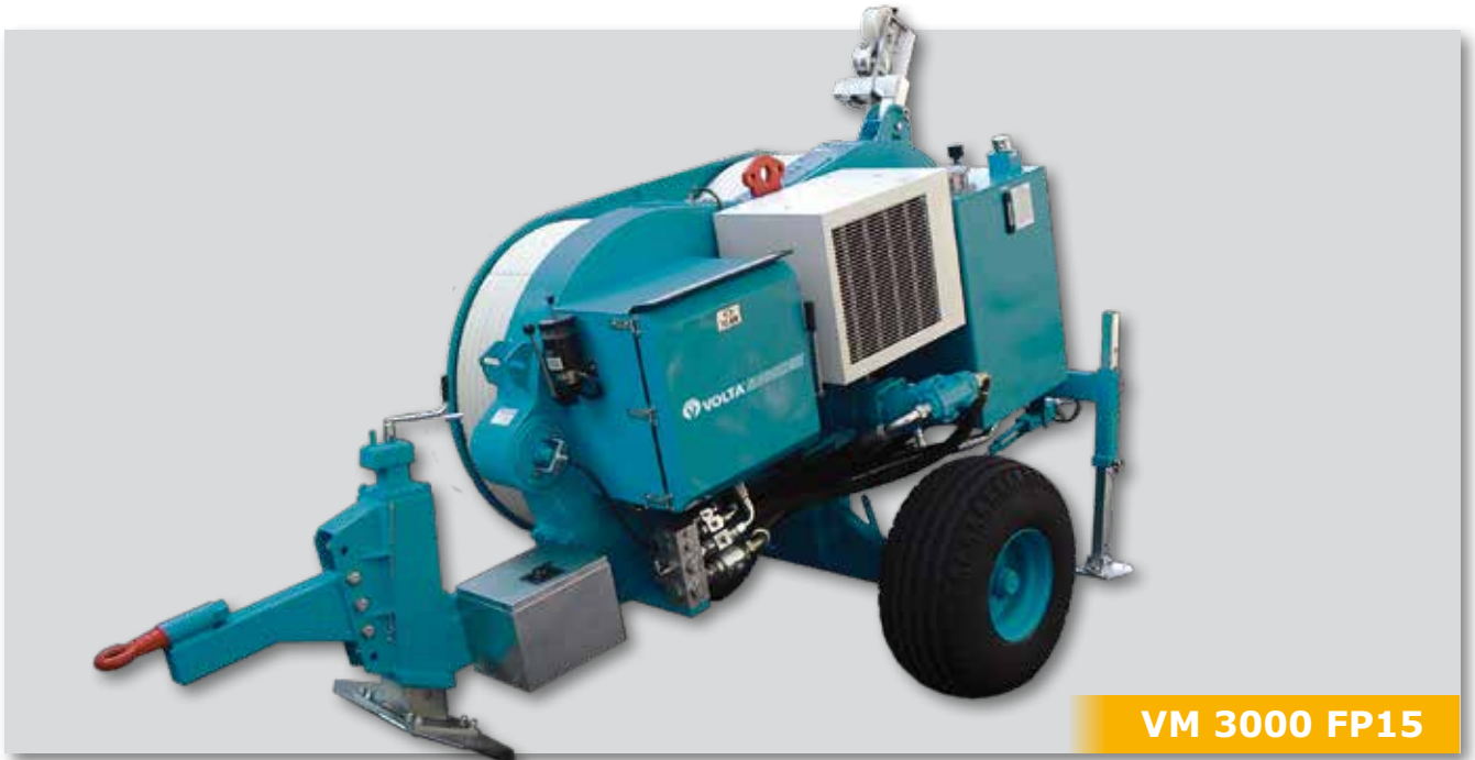
VM 3000 FP15