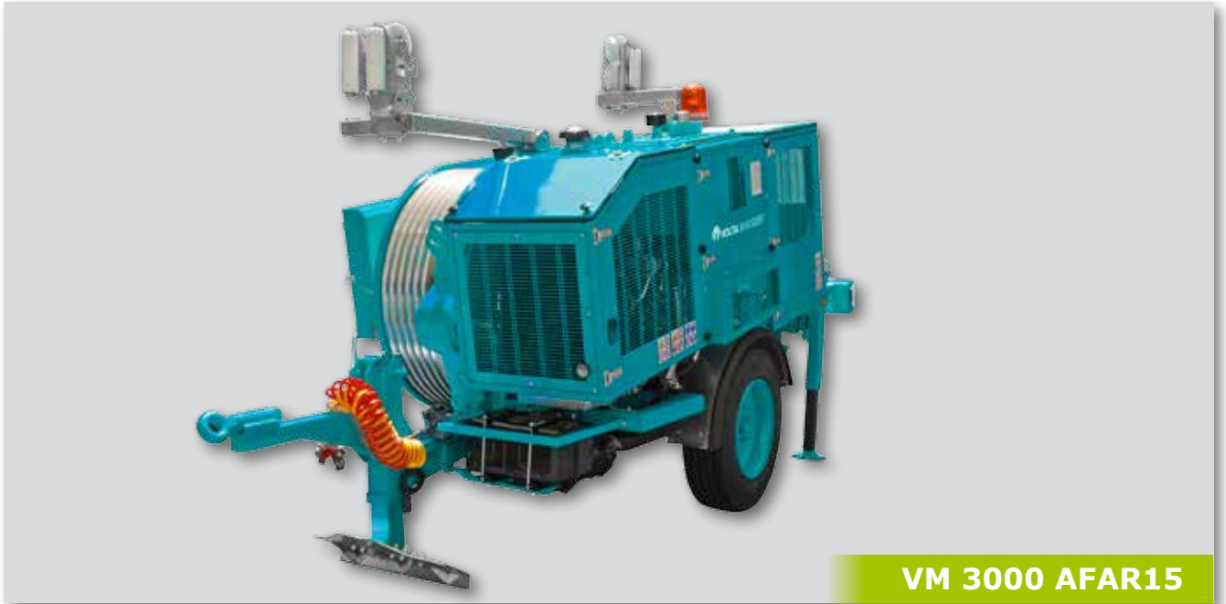
VM 3000 AFAR15