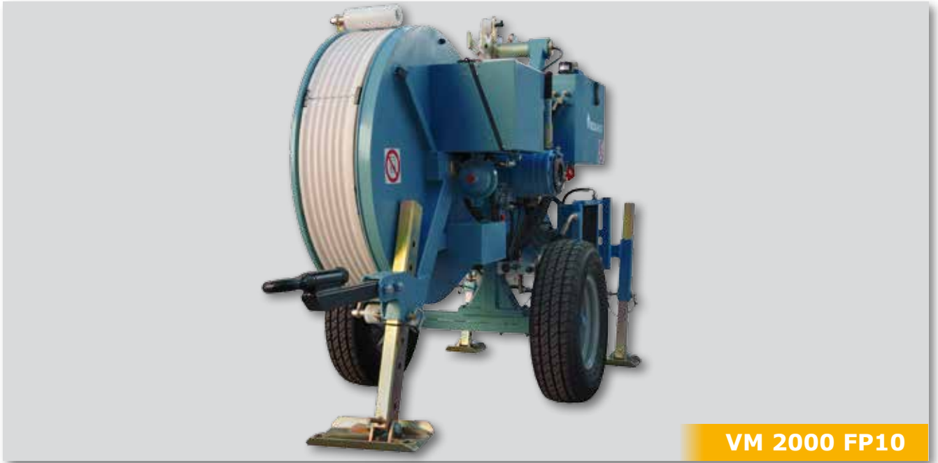
VM 2000 FP10