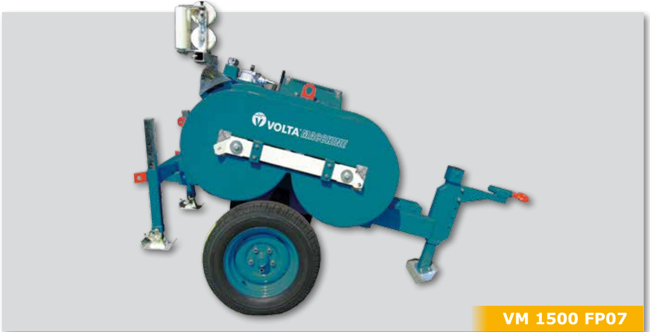
VM 1500 FP07