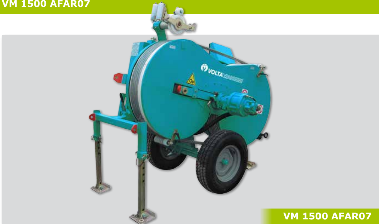
VM 1500 AFAR07