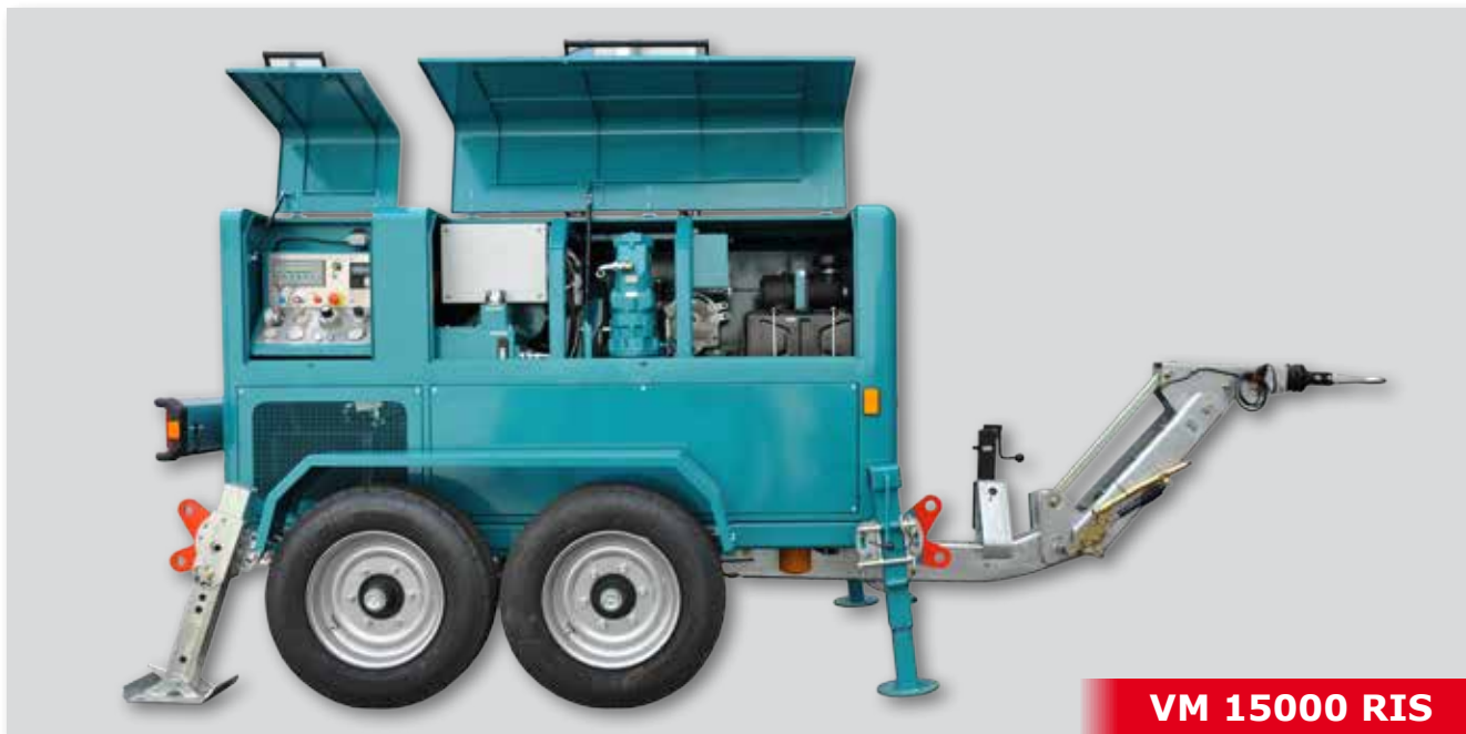
VM 15000 RIS